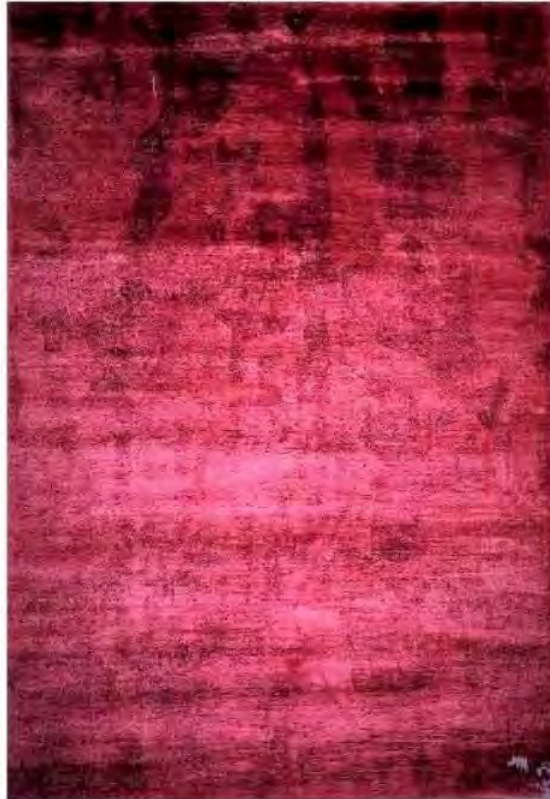
Alfombra Almost Red del catálogo de Nodus y chandelier Lula Silk de Windfall

Una manera es con una alfombra como la Almost Red , diseñada por el dúo de artistas belgas Sofie Lachaert y Luc D'Hanis para Nodus . Anudada a mano en Nepal con seda desarrollada a partir de plátano. Con unas dimensiones de 200 cm x 300 cm, puede usarse también como un tapiz en la pared. Viene en un único color que impacta con los contrastes de tonos y las estratégicas inserciones de hilos blancos.