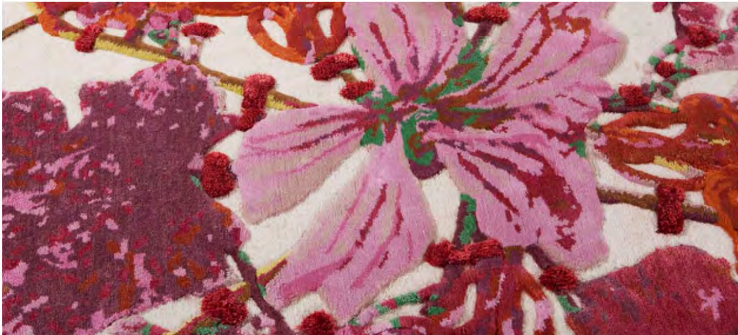
La alfombra Harmony de la línea Savage flowers de Kiki van Eijk para Nodus refleja tonos magenta entre ellos el Viva Magenta