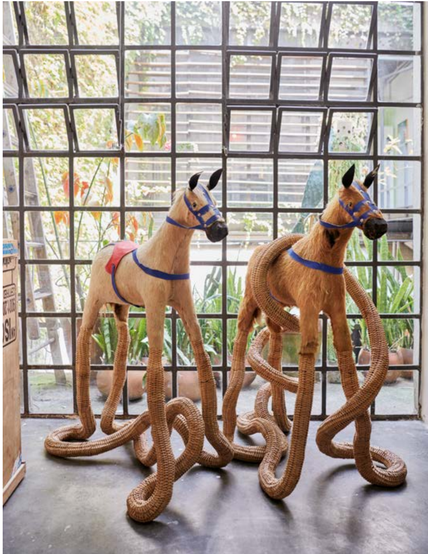
Sculptures Cavalinho (2018). Chevaux en peluche, cuir et osier.