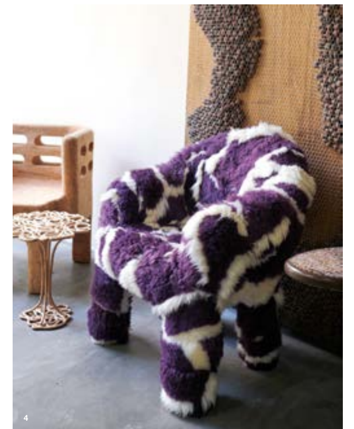
1. Fauteuil Café (2011). Bois et osier tressé. 2. Siège Bulbo (2019) pour la collection Objets Nomades de Louis Vuitton. Cuir et tissu. 3. Fauteuil Meteora , prototype (2019). Polystyrène et cuir. 4. Fauteuil Raizes (2017). Plastique recouvert d'une peau de mouton.