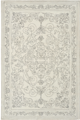
one stroke 1/1

Della stessa serie: From the same series: