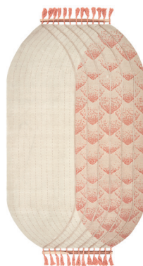
Terra incognita: Phoenix