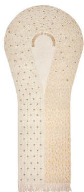
Terra incognita: Grypho

Della stessa serie: From the same series: