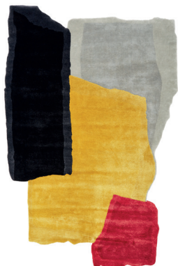
Ripped, teared and colored carpet 1

Della stessa serie: From the same series: