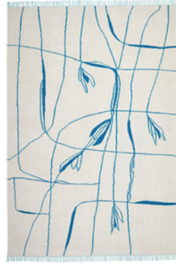
Ravie bleu clair