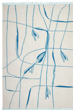
Ravie bleu clair