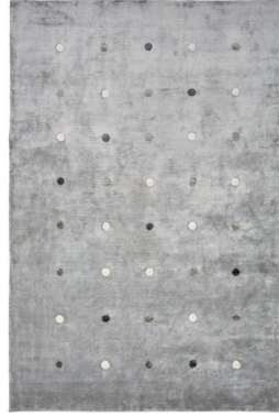
Punti grey mix