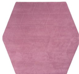
Lhotse 4 pink