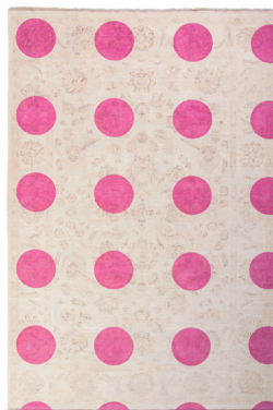
Double layer pink