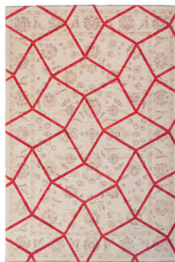
Double layer red