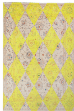
Double layer yellow