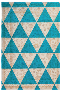
Double layer blue

Della stessa serie: From the same series: