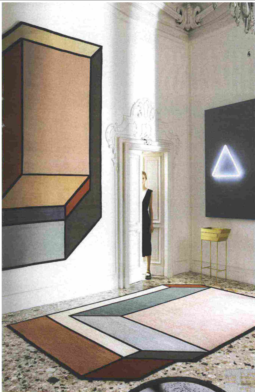
4 "Visioni A" e "Visione B", in lana himalainiana e seta. Design Patricia Urquiola. Cc-Tapis. 5 "Kaldo", in feltro. Design Hanna Ernsting & Sarah Böttger. Nodus. 6 "Eye & Mouth", stampa su tessuto. Seletti wears Toiletpaper. 7 "Rose", in lana e viscosa. Pixel Collection. Stepevi.