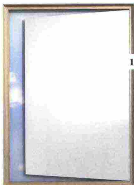
1. DAYDREAM DI RON GILAD PER CASSINA. SPECCHIO DA PARETE DALLA COLLEZIONE DEADLINE, CON EFFETTO GRAFICO SURREALE CHE RICHIAMA I QUADRI DI MAGRITTE.

Divani in equilibrio precario, sgabelli che si trasformano magicamente in quadri, specchi che sembrano soglie d'accesso a segreti mondi paralleli, tappeti che sfidano la terza dimensione, citazioni alle improbabili geometrie di Escher e ai surrealisti di Magritte. Sono sempre più numerosi i divertissement progettuali che esprimono uno spirito libero e ludico del design, centrati soprattutto sull'ambiguità visiva tra realtà 2D e 3D. ■ Katrin Cosseta