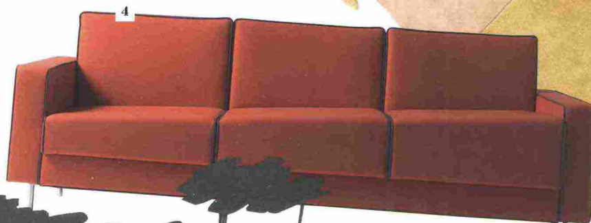
4. ADAPTION, DISEGNATO DA FABIO NOVEMBRE PER CAPPELLINI. DIVANO IN PELLE O TESSUTO CHE GIOCA SULL'ILLUSTIONE DELLA SEDUTA OBLIQUA 5. GRIBUILLE DI GAETAN COULAUD PER ROCHE BOBOIS. TAVOLINO IN LAMIERA D'ACCIAIO