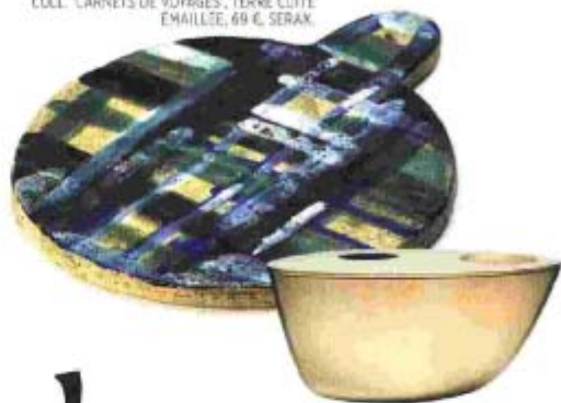
DIFFUSEUR D'HUILES ESSENTIELLES, DESIGN STUDIO HENRY WILSON, LAITON MASSIF, 143 €, AFSOP.