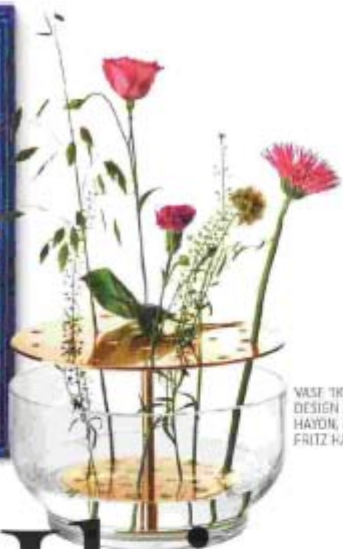
VASE "TRIFANA", DESIGN JAIME HAYON, ØPD 99 €, FRITZ HANSEN.