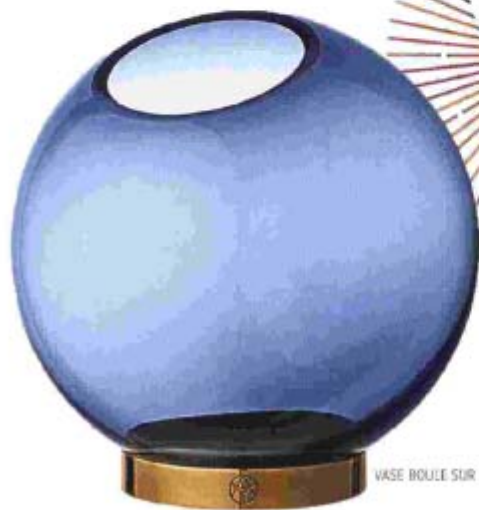
VASE BOULE SUR SOCLE EN LAITON, TROIS FORMATS DIFFÉRENTS, ØPD 35 €, AYTM.

Du beige et du bleu lumineux: on n'a encore rien inventé de mieux pour chasser le blues d'automne.