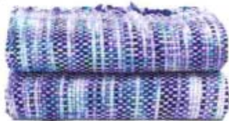
COUVERTURE, 130 x 170 CM, 69,99 €, ZARA HOME.

OFFICIAL PARTNER OF THE 2018 IBIZA MUSIC FESTIVAL