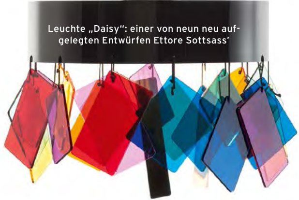
Leuchte „Daisy“: einer von neun neu aufgelegten Entwürfen Ettore Sottsass'

Hier ist das Leben ein Ponyhof! Die Farbfilter von Leuchte „Chroma“ können nach Belieben gemixt werden (Arturo Erbsman)