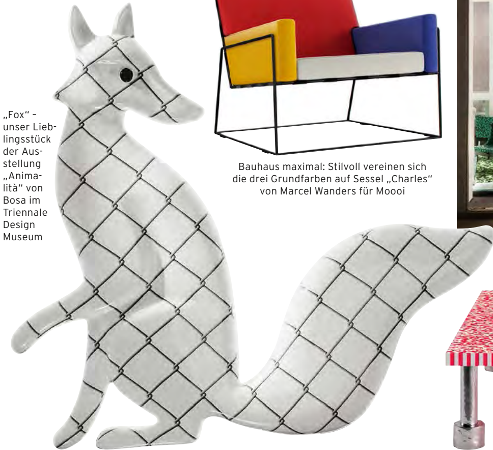
„Fox“ - unser Lieblingsstück der Ausstellung „Animalità“ von Bosa im Triennale Design Museum

Design-Maestro Ettore Sottsass sorgte schon zu Lebzeiten für jede Menge Furore. Vor einigen Jahren entfachten vergessene Skizzen des Designers, die in einer Schublade wiederentdeckt wurden, Aufregung im Hause Kartell. Zur diesjährigen Möbelmesse ehrte das Label den Altmeister mit den frisch aufgelegten Entwürfen, kleidete Showroom und Möbel in Stoffe von Memphis - Sottsass' wohl revolutionärstem Abenteuer