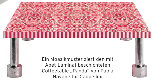
Ein Moasikmuster ziert den mit Abet-Laminat beschichteten Coffeetable „Panda“ von Paola Navone für Cappellini

Stores befindet sich nur wenige Schritte vom Dom entfernt in der Via Victor Hugo 1, www.labitinoeasyhich.it