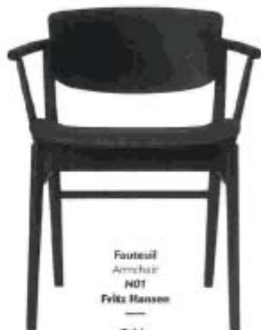
Fauteuil Armchair HD1 Felix Hansson — Table Table Sesaw Marsotto Edizioni