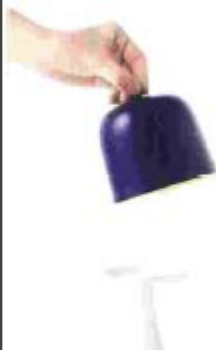
Contenanti et cloches Containers with bell lids Suzu Sévres