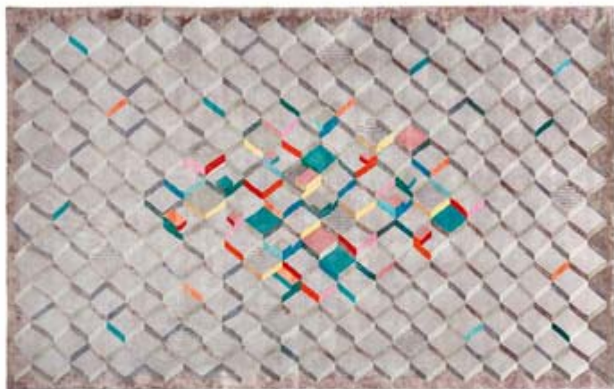
Ковер La Lomita, дизайнер Лилиана Овалье, Nodus

Оптические рисунки-обманки в духе Вазарелли (в случае с ковром марки Nodus они символизируют городской пейзаж) и композиции из геометрических фигур, как на картинах супрематистов, – такое впечатление, что дизайнеры искали вдохновения в музее современного искусства.