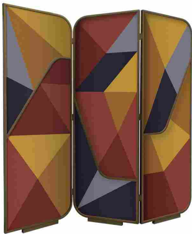
Shade Abstraction, Carlo Donati Studio.

Al civico 19, all'interno dell'edificio P19 appena terminato e firmato da Carlo Donati Studio , architettura, pittura e design si incontrano in un dialogo di suggestioni; qui Shade Abstraction presenterà alcuni paraventi e un grande dipinto dell'artista Marco Petrus.