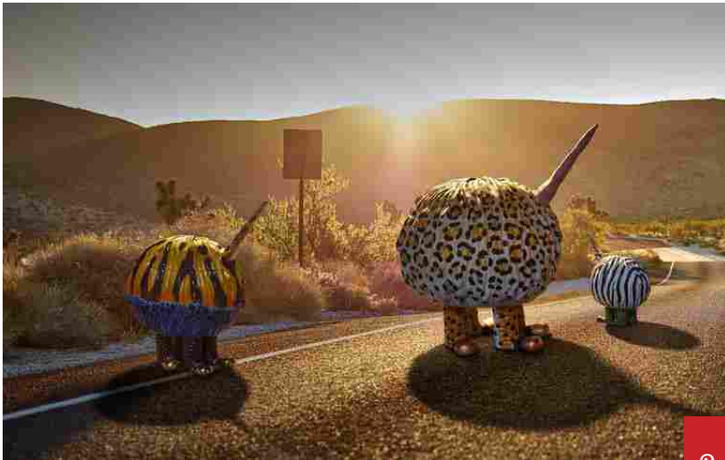
Dilmos, Haas Brothers per L'Object.