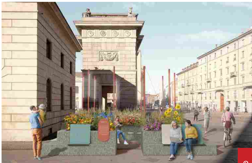
Pratofiorito, Eataly Milano Smeraldo e Slow Food.

Impatto scenico a effetto assicurato: un alieno alto 6 metri atterrerà come in un film di Steven Spielberg in Piazza XXV Aprile. Lui si chiama RoBOTL ed è il supereroe della sostenibilità, in perfetta sintonia con il tema scelto da questa edizione di Brera Design District: Design your Life . L'autore non è Carlo Rambaldi, il famoso papà di E.T, bensì Timberland e il pluripremiato studio di Giò Forma (Cristiana Picco, Claudio Santucci e Florian Boje). La piazza ospita anche il giardino temporaneo Pratofiorito a cura di Davide Fabio Colaci, che è la proposta di quest'anno di Eataly Milano Smeraldo e Slow Food.