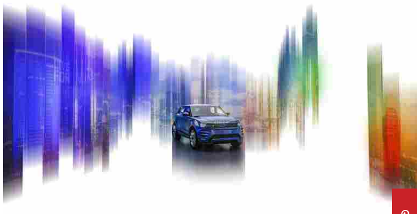
Range Rover Evoque by Land Rover.