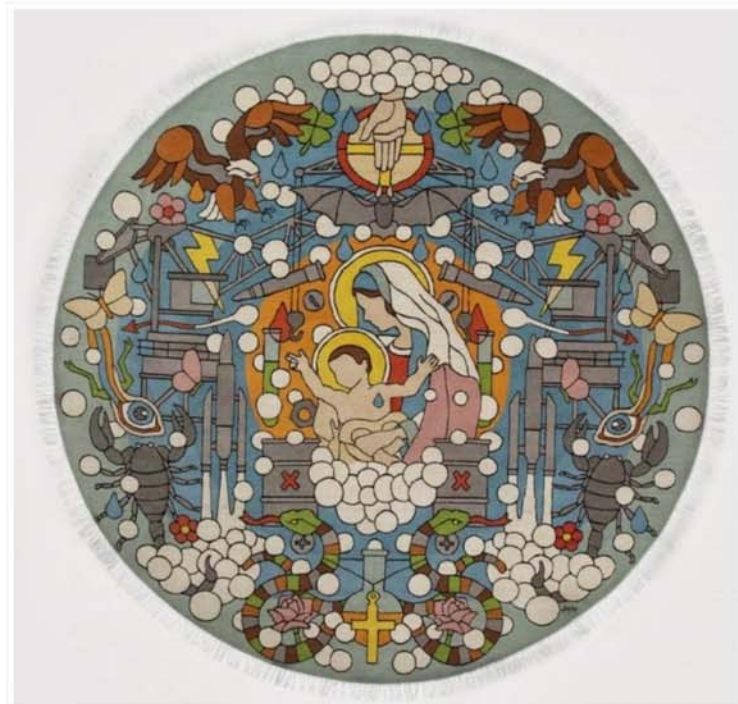
Birth rug, by Studio Job, 12 pieces limited edition, Ø220cm, €13.500, at Nodus. Tapete Birth, por Studio Job, edição limitada a 12 peças, Ø220cm, €13.500, da Nodus.

se fosse meu nunca iria para o chão para ser pisado. se fosse meu, faria um altar e este seria o retábulo principal.