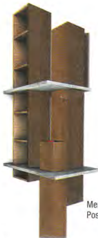
Memphis/ Post Design