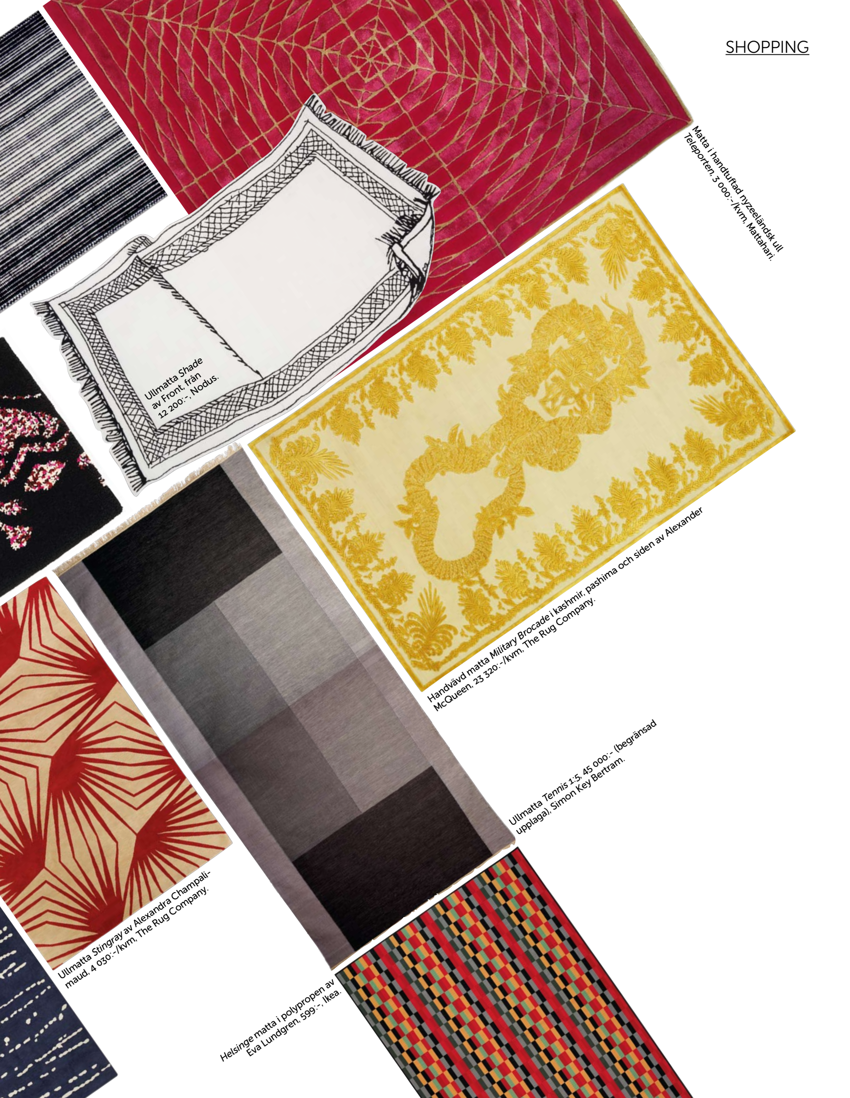
Matta i handtuftad ryzeländsk ull Teleporten. 3 000,-/kvm. Mattaheri.