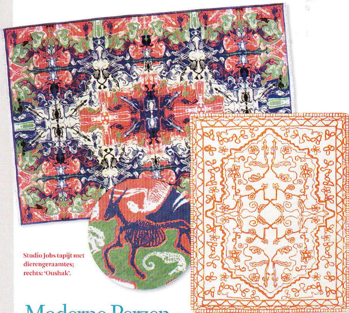
Studio Jobs tapijt met dierengeraamtes; rechts: 'Oushak'.