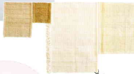
Vloerkleed Balance van BCXSY.