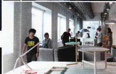
Obras de Tomás Alonso en el salón Young Talents de Elle Decor Italia.