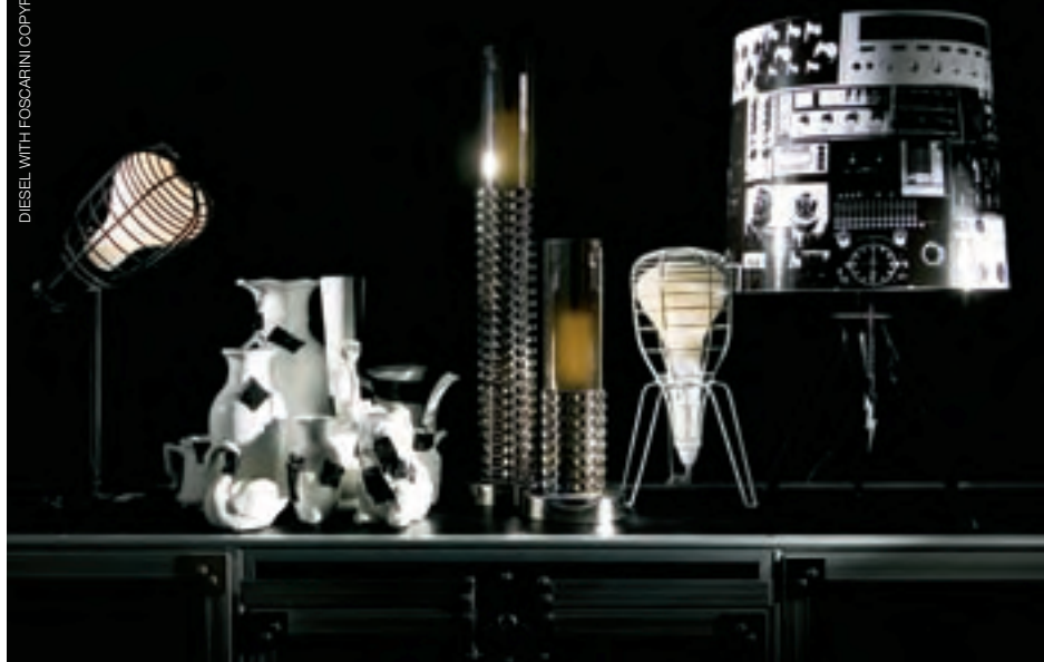
DIESEL WITH FOSCARINI COPYRIGHT : DR

Un éclairage signé Diesel | Les luminaires de Diesel sont à l'image des collections prêt-à-porter de la maison de couture italienne : créatifs, ludiques et bigarrés. Associé à Foscarini, une firme spécialisée en mobilier design, le géant du jeans a imaginé Successful Living. Cette gamme d'éclairages à suspendre ou à poser sur un bureau évoque les lampes d'usines et de chantiers. Allumés, ils émettent une lueur diffuse à travers leur abat-jour en verre satiné. Éteints, ces luminaires – présentés au Salon du design intérieur de Toronto (IDS) en janvier dernier – brillent tels des miroirs avec leur finition en chrome. Un design qui fait parfaitement écho à la signature rock et vintage de la marque.