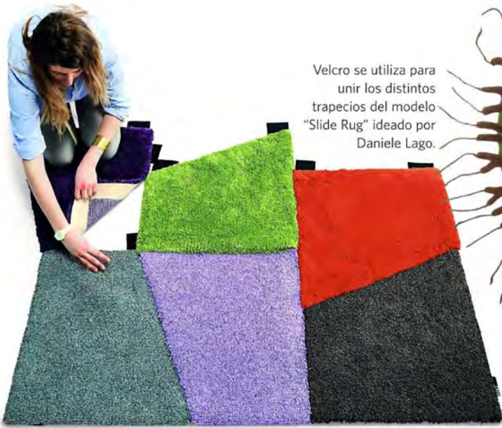
Velcro se utiliza para unir los distintos trapecios del modelo "Slide Rug" ideado por Daniele Lago.