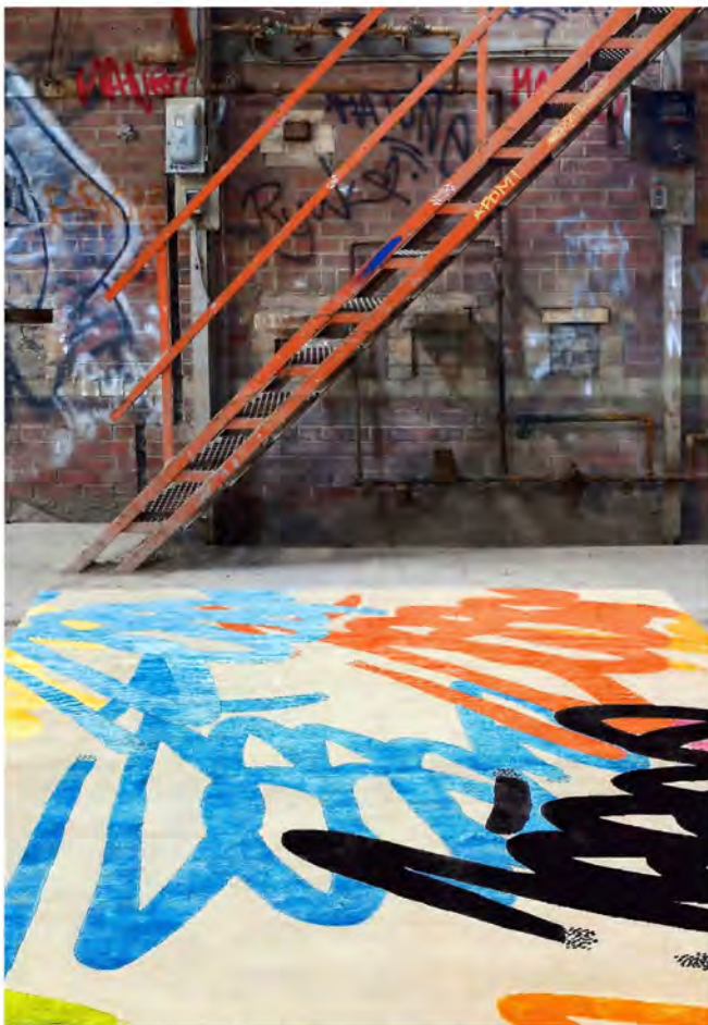
Colorantes vegetales y minerales se emplearon para teñir las lanas y sedas-viscosa que dan forma a la colorida alfombra "Manhattan" de Illulian.