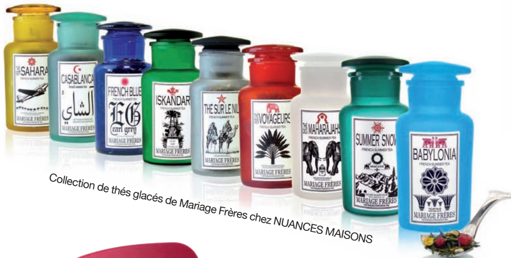
Collection de thés glacés de Mariage Frères chez NUANCES MAISONS