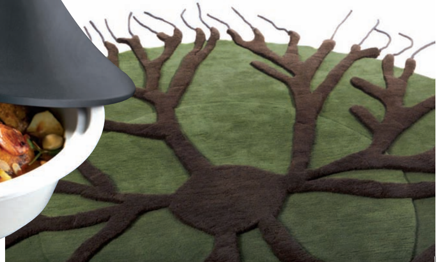
Roots de Matali Crasset pour Nodus, un tapis en édition limitée qui célèbre la nature