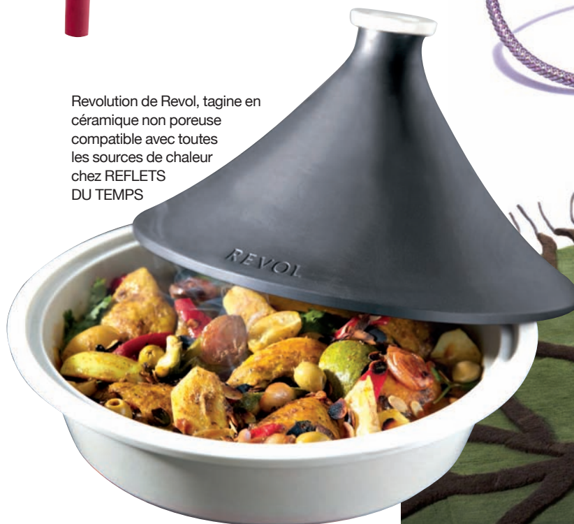
Revolution de Revol, tagine en céramique non poreuse compatible avec toutes les sources de chaleur chez REFLETS DU TEMPS