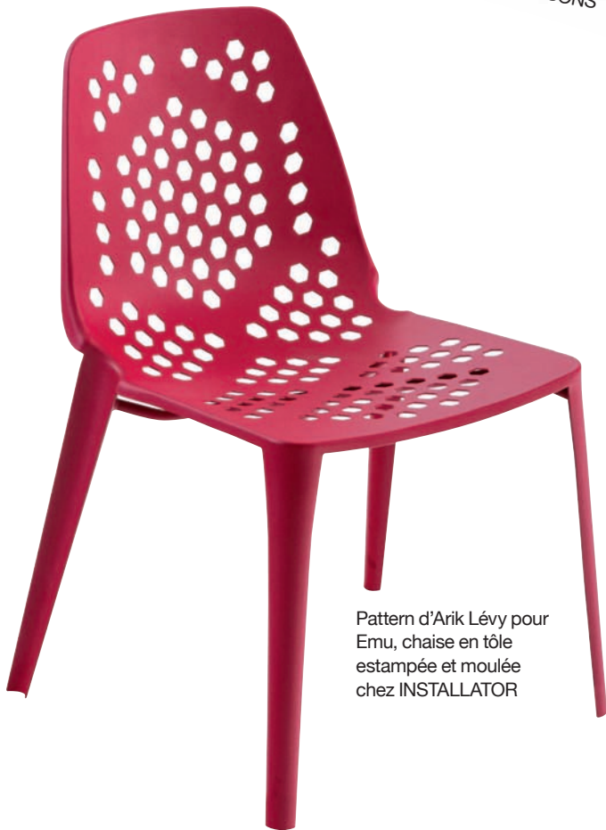
Pattern d'Arik Lévy pour Emu, chaise en tôle estampée et moulée chez INSTALLATOR