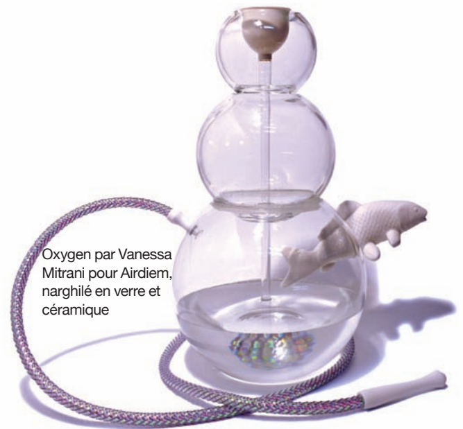
Oxygen par Vanessa Mitrani pour Airdiem, narghilé en verre et céramique